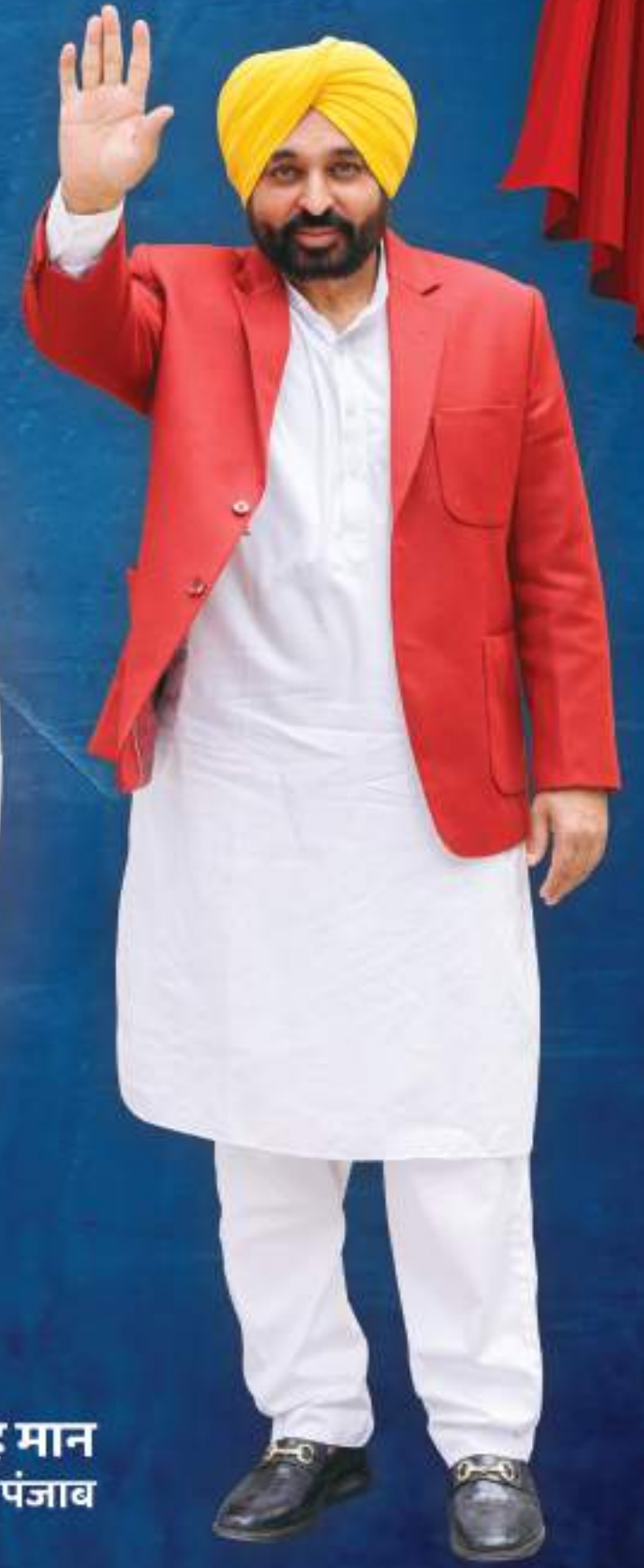
भगवंत सिंह मान मुख्य मंत्री, पंजाब